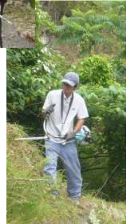
急な法面にも挑戦！