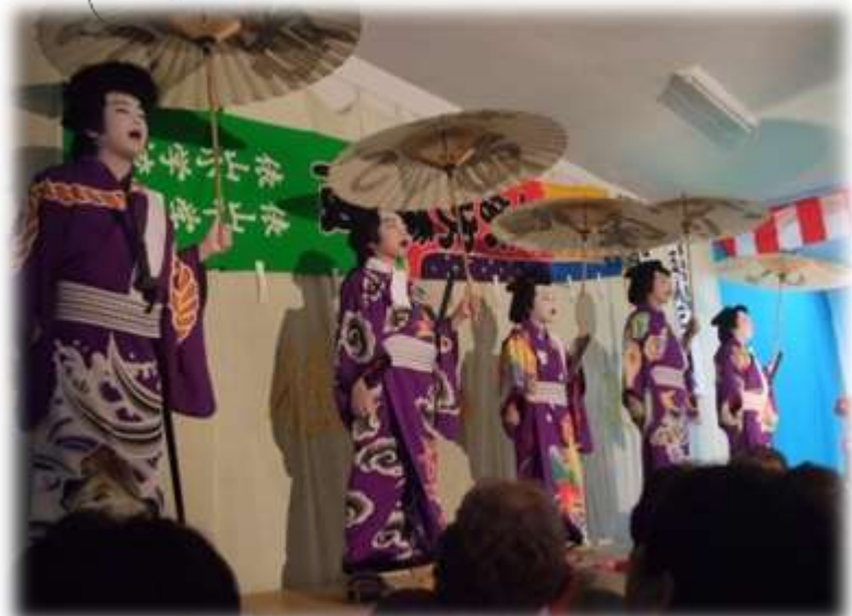
雨の中にもかかわらず、いろいろなイベントで盛り上がった会場