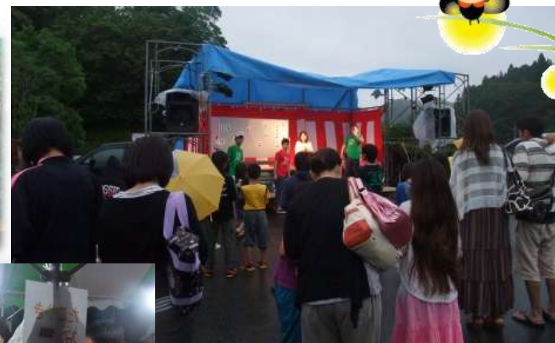
たくさんのご来場の方々に感謝!