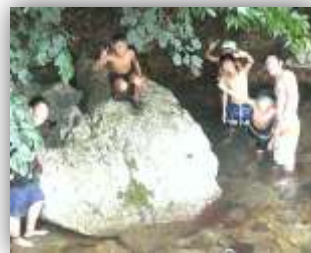
昨年の子どもプロジェクトの様子

今年の子どもプロジェクトには、防府市立向島小学校4、5年生、23名が参加します。日程は7月24日(火)～27日(金)。里山ステーションを拠点に、様々な体験を行う予定です。何かとにぎやかになります。ご協力のほどよろしくお願いいたします。(K・Y)