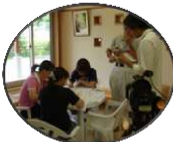
打ち合わせは念入りに!