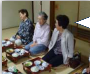
初対面とは思えない打ち解け様

まず、小学校を訪問し、子ども 歌舞伎の練習を見学。次に、宿泊 先の旅館に落ち着いたあと、温泉 に浸かって疲れを解消。午後8時 過ぎには蛍バスで蛍を観賞。暗闇 に乱舞する蛍にビックリされてい ました。(H・M)