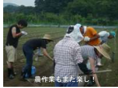
農作業もまた楽し!