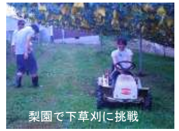
梨園で下草刈りに挑戦