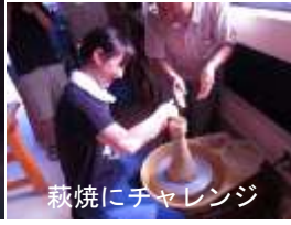
萩焼にチャレンジ