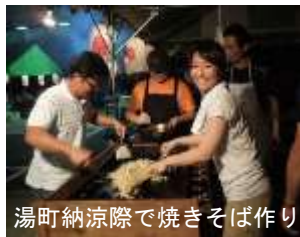
湯町納涼祭で焼きそば作り