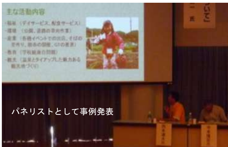
パネリストとして事例発表