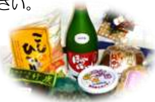
写真はイメージです (昨年のほろ酔いセット)