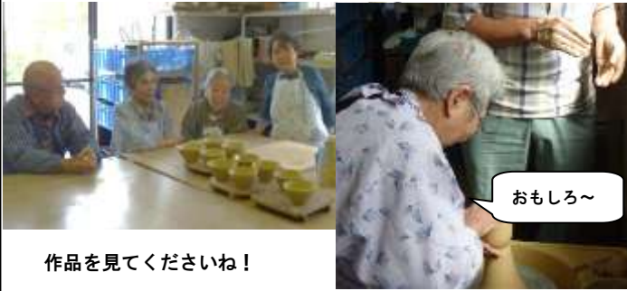
作品を見て下さいね!

今月の「しあわせくらぶ」は、俵山文化産業祭に出品する作品作りに忙しい準備期間です。陶芸やちぎり絵など、いろんな力作が出来上がっています。是非、文化祭では「しあわせくらぶ」の作品をご覧になってくださいね。(H・M)