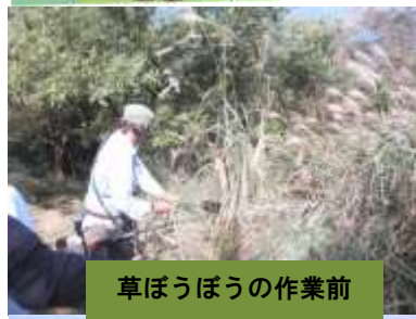
草ぼうぼうの作業前