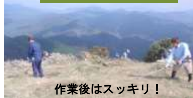
作業後はスッキリ！