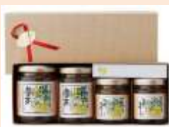
百貨店のギフトセット

さて、お陰様で2トンものゆずを収穫でき、順調に製造しております。この度は、ふるさと宅配便にも商品を詰めて発送しました。また、高島屋や井筒屋のお歳暮としてもお取り扱いされ、徐々にブランドとして定着してきているようです。ここ里山ステーションにも取り揃えておりますので、お遣い物にいかがでしょうか (Y・H)