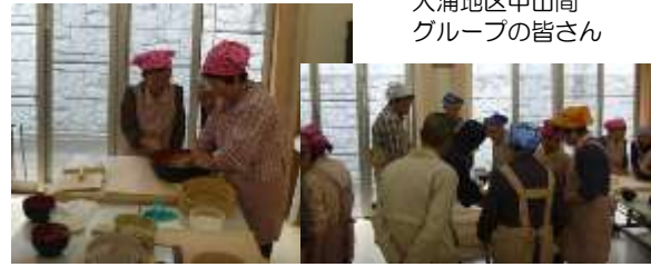
大浦地区中山間グループの皆さん