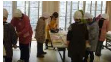
俵山婦人会の皆さん